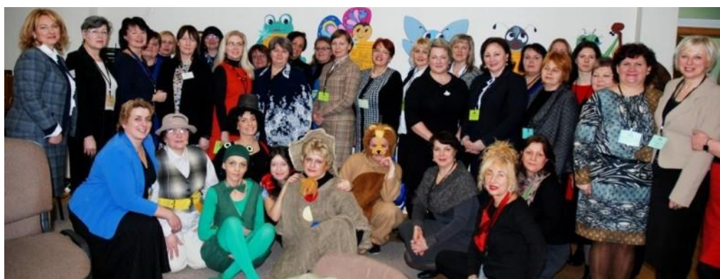
Publikaciją rengė: projektų vadovė Saulė Šerėnienė