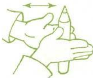
Ridename pieštuką tarp delniukų.

Padėk pieštuką ant vieno delniuko ir uždenk jį kitu. Paridenk pieštuką tarp delniukų iš pradžių lėtai, po to greitai. O dabar pabandyk ta pati padaryti su dviem pieštukais.